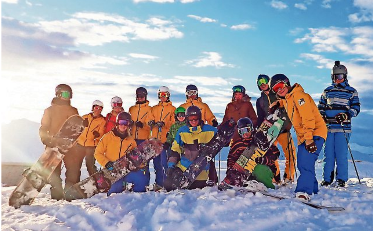
Die Mitglieder des Skiclubs Rothrist erleben gemeinsam unvergessliche Momente.