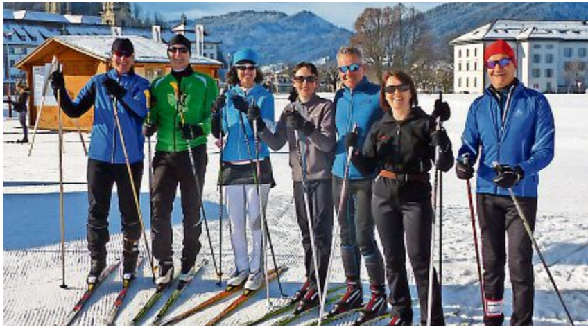
Die Mitglieder des Skiclubs Rothrist geniessen viele Aktivitäten.

Es geht etwas beim Skiclub Rothrist! Am Sonntag steht bereits der vierte Snowday auf dem Programm und im März gibts sogar eine Mondscheintour!