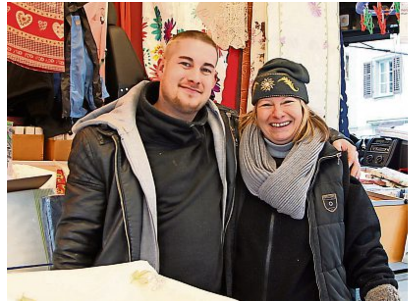
Am Monatsmarkt herrschte trotz klirrender Kälte gute Stimmung! bs