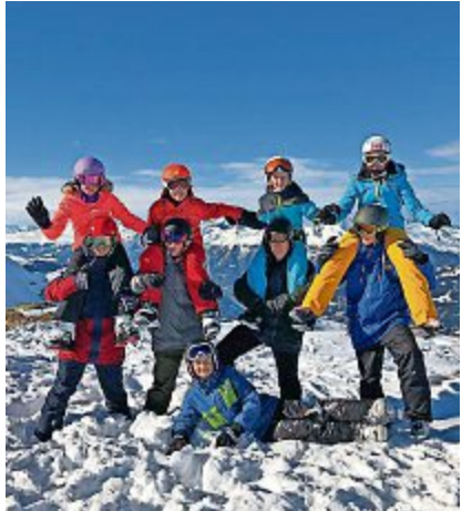
Skiclub Rothrist: Spass und Action durchs ganze Jahr hindurch.

Samstag, 3. März. Vom 19. bis 21. Mai geht es dann aufs Fahrrad: In der Zentralschweiz werden die Bike Tage durchgeführt. Dem Skiclub beitreten kann man unter www.skiclub-rothrist.ch